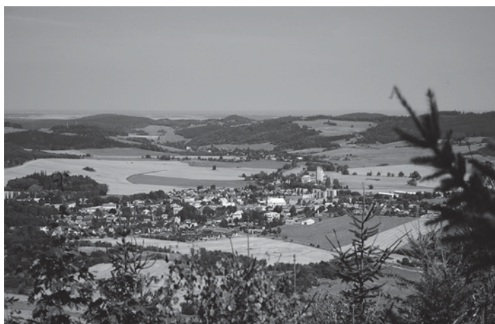
Úchvatné hřebenové pohledy na město a jeho okolí

Městský turistický okruh bude mít 5 základních stanovišť: Poutní hora - Hradiště Burkvíz - Linhartovský zámek - Rozhledna na Hraničním vrchu a Dubí vrch. V tomto 25 km dlouhém okruhu jsou dvě naučné stezky.