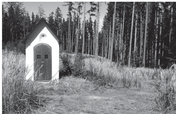
Kaplička pamatuje v poslední době několik Ebenových Truvéřských mší

Linhartovský zámek je kulturní perlou našeho kraje, dominuje pověst o Mouřenínovi, starobylý buk v zámeckém parku a ze sbírek zámku je to např. keramika J. Kutálka, která každoročně láká návštěvníky z celé republiky. Od zámku směrem na Polsko