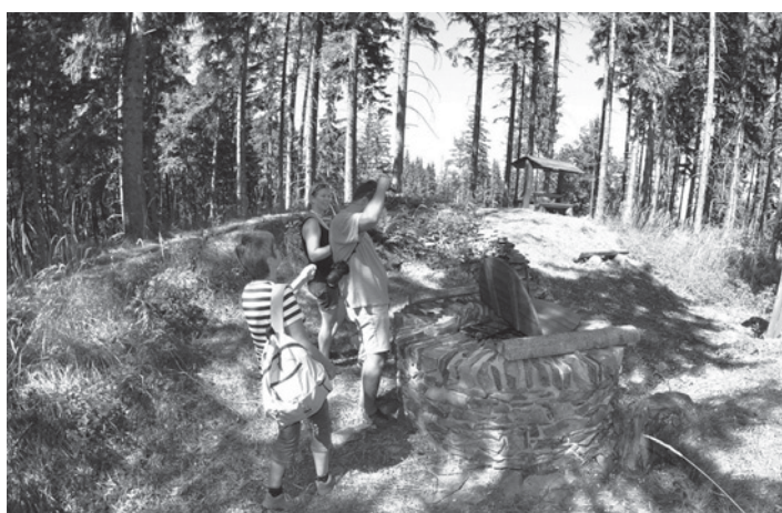
Na hradišti Burkvíz je stále co fotit

Když v roce 2010 proběhla u kapličky pod Poutní horou první Ebenova Truvéřská mše, začalo se mezi turisty nesměle mluvit o obnovení tzv. Křížové cesty, která by kopírovala více než 350letou náboženskou tradici. Jako příkladu bylo využito zkušeností při budování první naučné stezky Dubí vrch. Díky mimořádné iniciativě vedení LČR v M. Albrechticích je i turisticko – naučná stezka Poutní hora téměř hotova. Její počátek začíná u nového kříže nad koupalištěm, kde do roku 1977 stávala starobylá kaplička a tam také po 25 km končí.