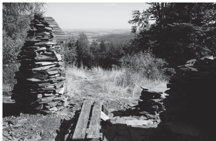
Poutní hora s břidlicovým krbem, jehlanem a odpočívadlem

Druhá , nově budovaná turistická naučná stezka Poutní hora , návštěvníky hodně překvapí, a to nejen krásnými výhledy, ale hlavně bohatou historií. Vždyť kostel, který zde stával, byl dominantou tohoto kraje. Jeho rozměry byly úctyhodné 42 m x 18 m x 15 m a scházely se u něj generace obyvatel širokého okolí na svých poutích. Od toho je i název hory. Další zajímavosti, které na stezce najdeme, jsou starobylý buk s obvodem kmene přes 4 m, dále pak opravená kaplička, dvě jezírka, kamenný hrádek, ale především kouzelné pohledy na M. Albrechtice a jejich široké okolí, úpatí Jeseníků, Krnovsko, Opavsko a do části Polska. Nádherné výhledy dávají tomuto místu zvláštní náboj a nostalgickou atmosféru.