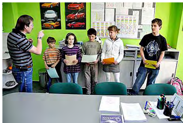
Ocenění za účast v soutěži Klokan ...