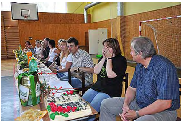
Učitelé při rozloučení s vycházejícími žáky ...