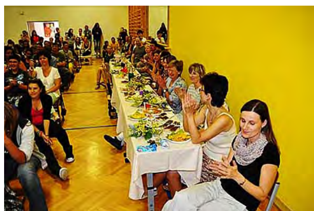
Rozloučení deváťáků ...