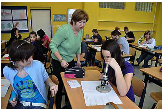
Laboratorní práce v přírodopisu ...