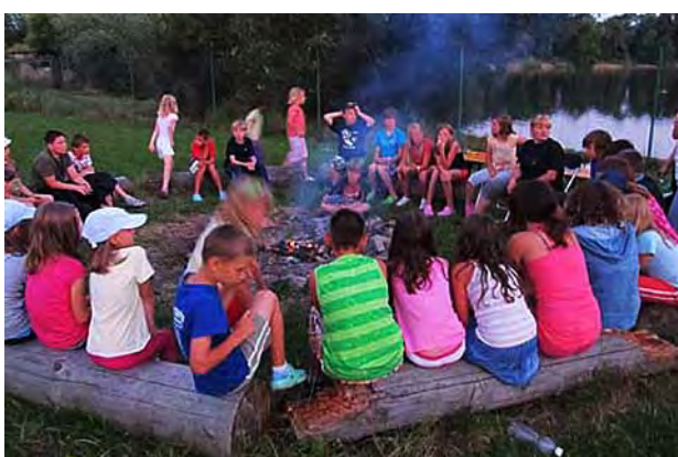
Na táboře je dobře ...