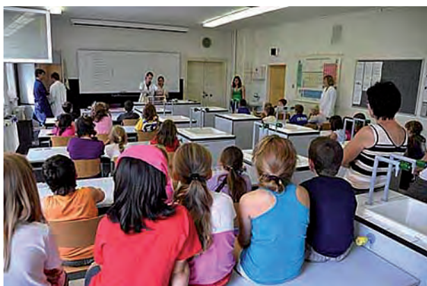
Deváťáci předvádí spolužákům pokusy ...