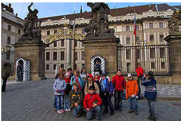
Páťáci na výletě v Praze ..