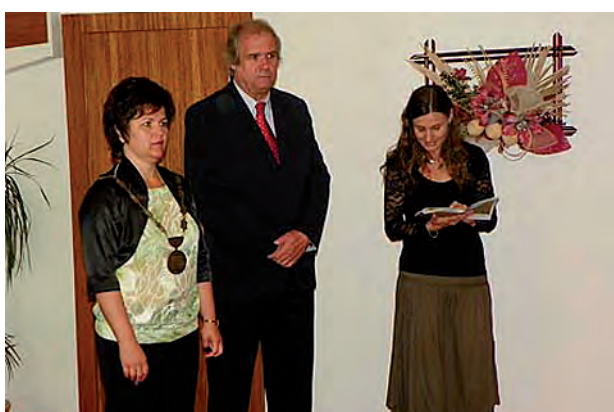
Rozloučení s deváťáky na MěÚ ...