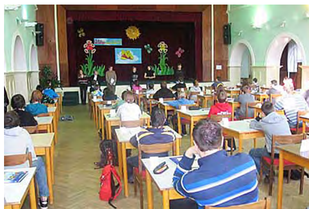
Na okresním kole Zempěpisné olympiády ...