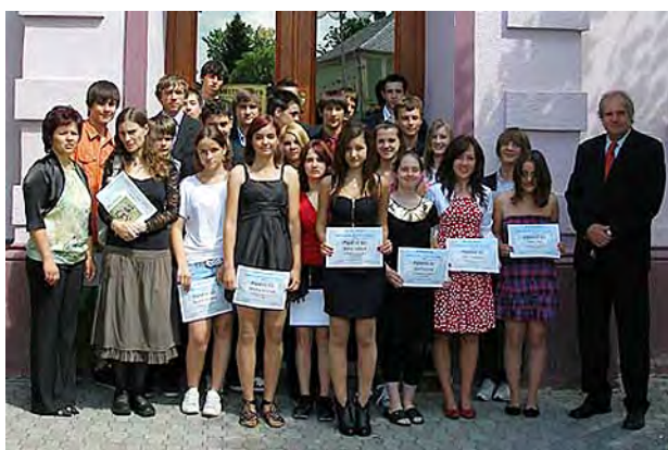
Deváťáci po rozloučení na MěÚ ...