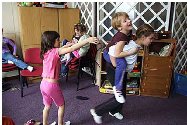
Ve školní družině si uijeme legrace ...