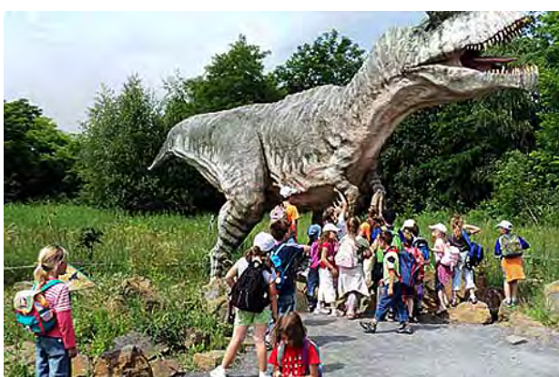
Na výletě v Dinoparku ...