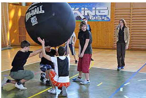
Učíme se hrát Kinn-baal ...