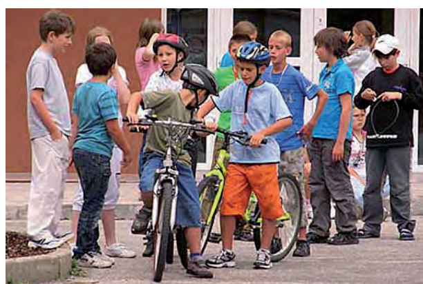
Školní kolo dopravní soutěže ...