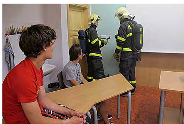
Námětové požární cvičení ...