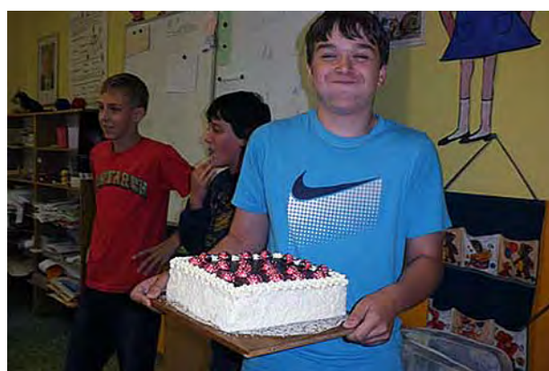
Na konci roku odměňovala i EKORADA ...