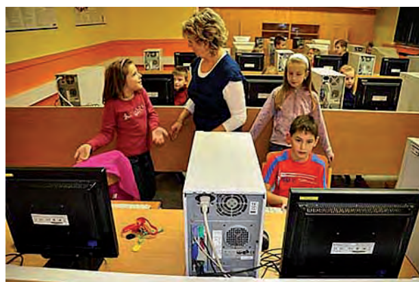
Školní kolo soutěže ZAV ...