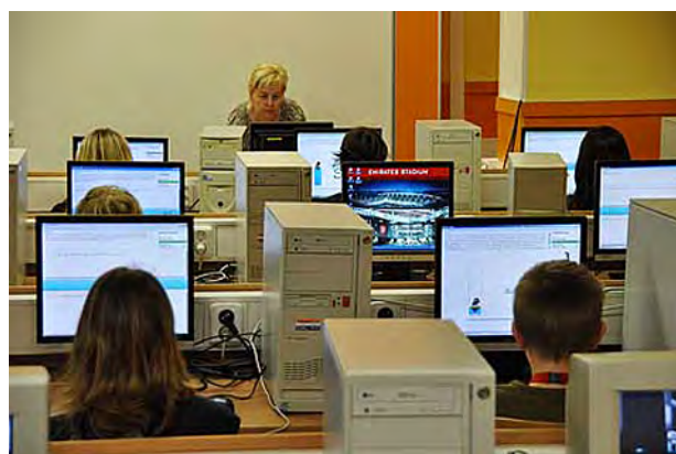
Školní kolo soutěže ZAV ...