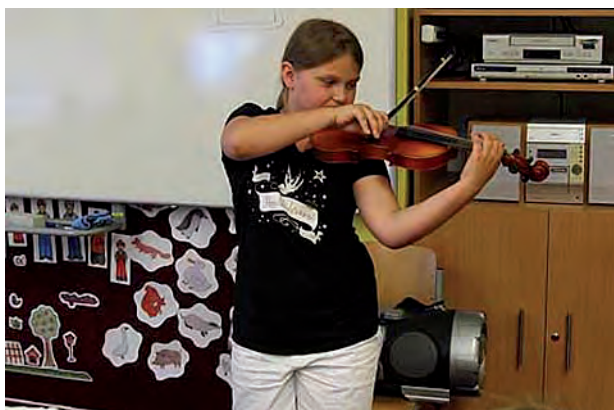
Spolupráce ZUŠ a ZŠ Město Albrechtice ...