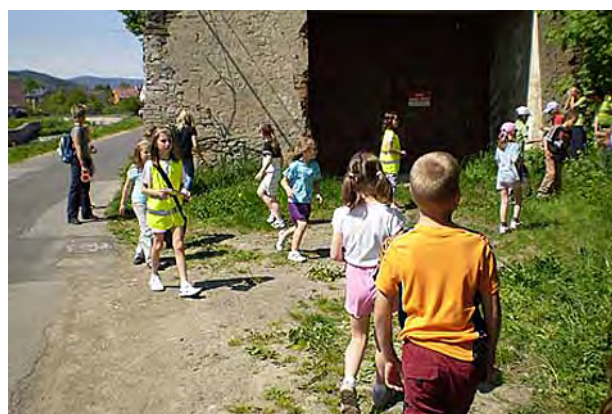
Družina hledá poklad ...