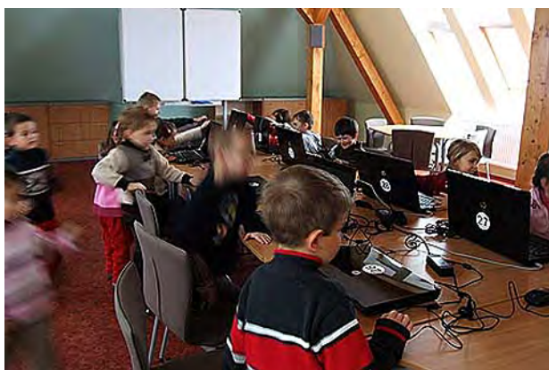
V informačním a komunitním centru ...