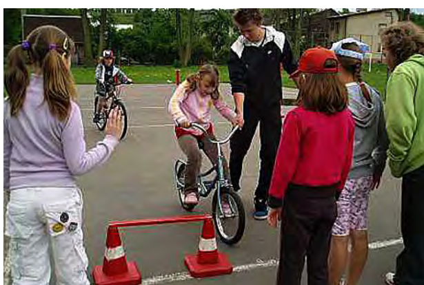
Nezapomínáme ani na dopravní výchovu ...