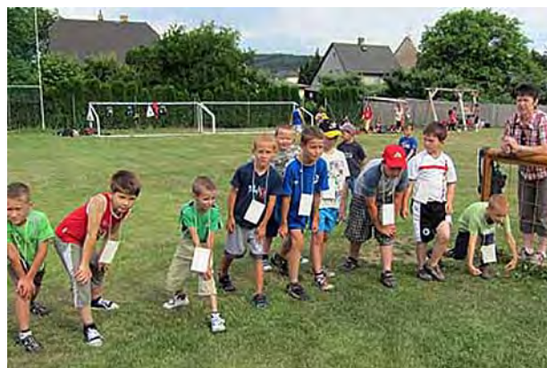
Lehkoatletický den dětí z I. stupně ...