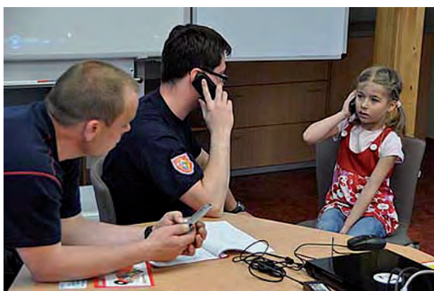
Prevence protipožární ochrany ...