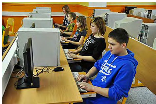
Výuka psaní na klávesnici PC metodou ZAV ...