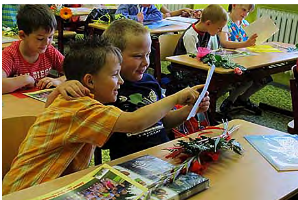
První vysvědčení i prázdniny ...