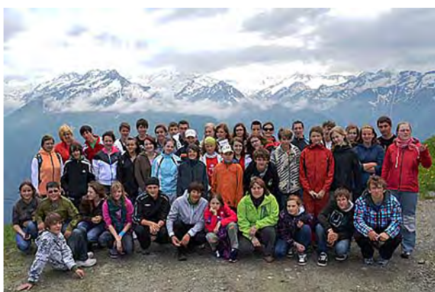
Na výletě v Rakousku ...