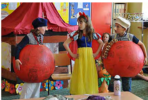
Děti z 3. B hrají pohádku ...