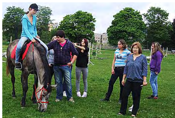
Učíme se o koních v praxi ...