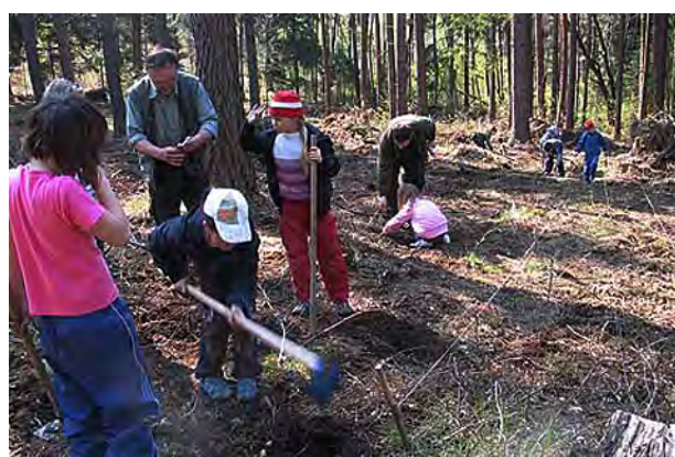
Sázíme stromky ...