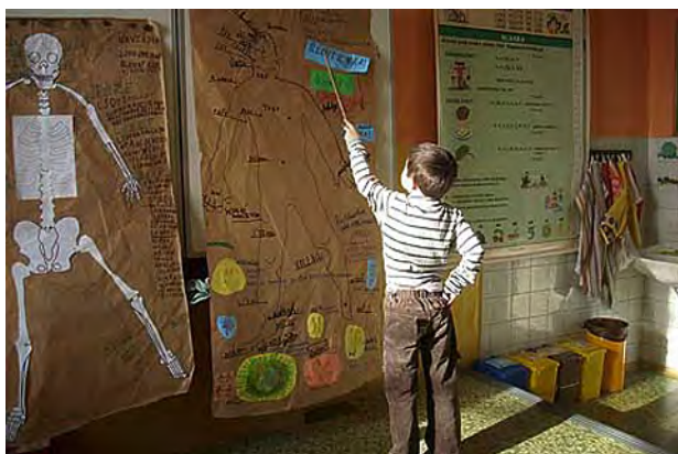
Projektová výuka na I. stupni ...