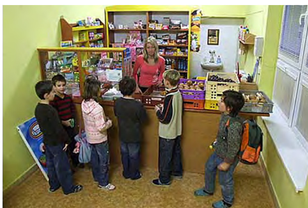
Ve školním bufetu ...