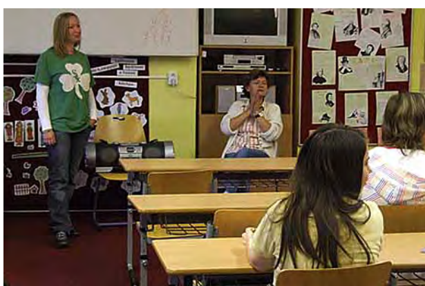
Návštěva z USA v hodině angličtiny ...