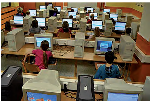
Školní kolo soutěže ZAV ...