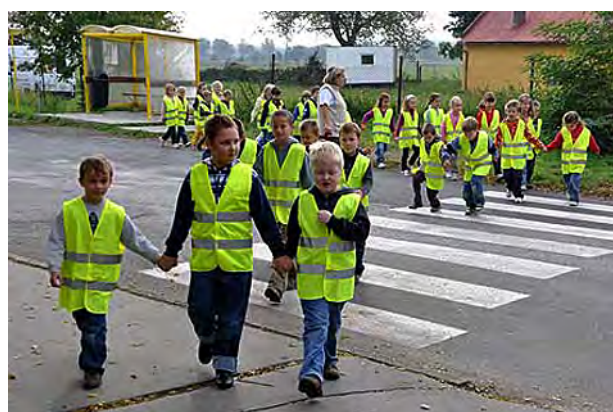
Bezpečnost především ...