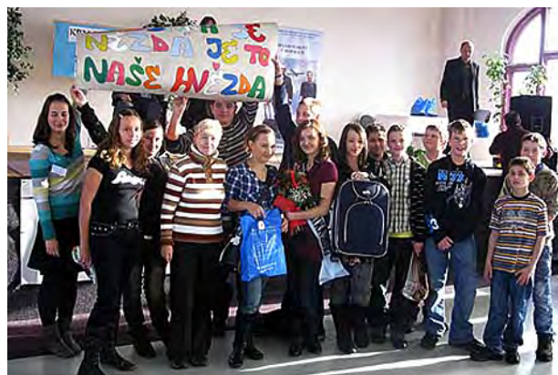
Barča byla na "Regině" v Krnově ...