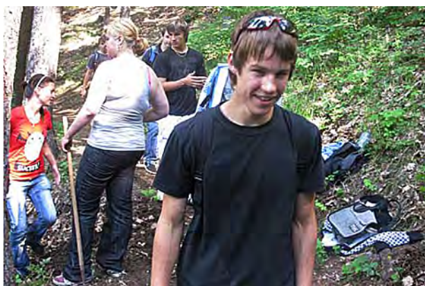
Na pomoc přírodě ...