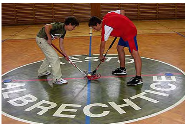
Rádi hrajeme florbal ...