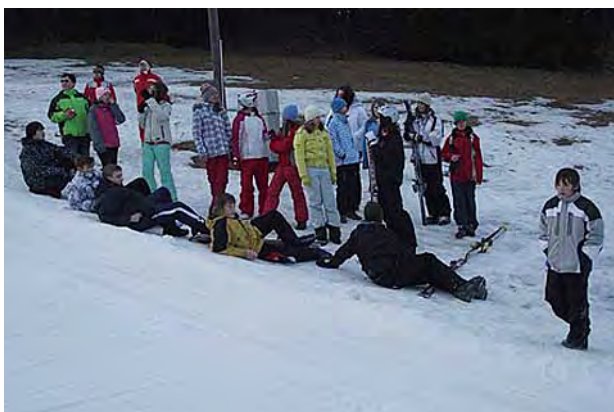
Lyžařský kurz žáků 7. tříd v Kopřivné ...