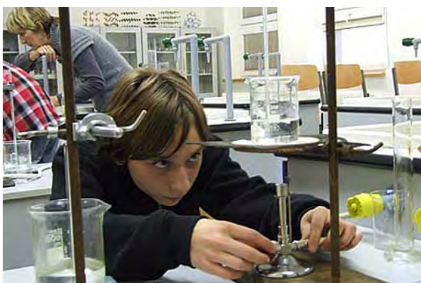
Vše si ověříme pokusem ...