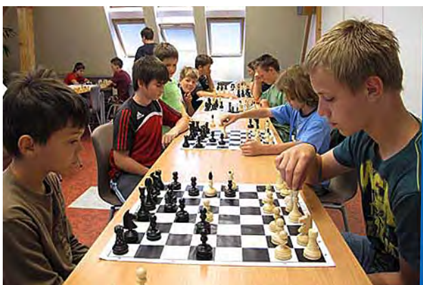
Další ročník šachového turnaje ...