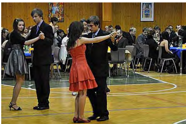
Plesík pro devátáky ...