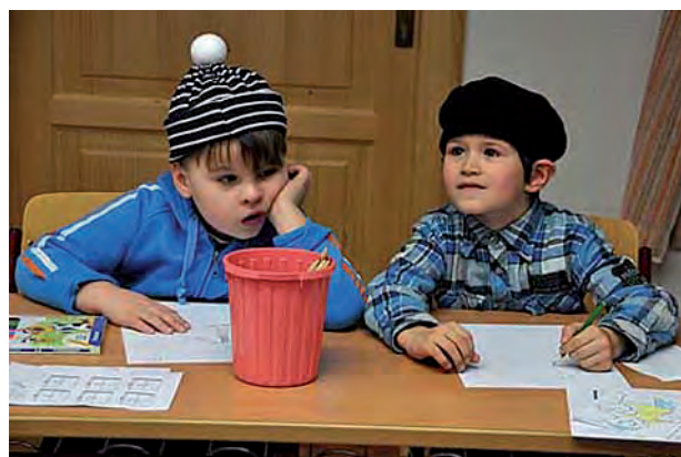
U zápisu pro školní rok 2011 - 2012 ...