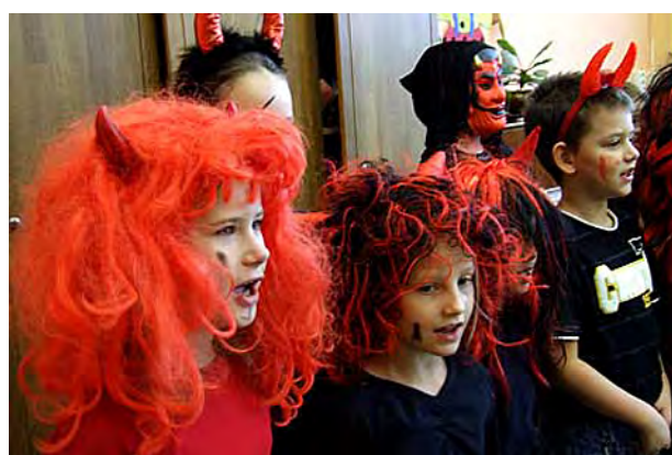
Přišel k nám Mikuláš i čerti ...