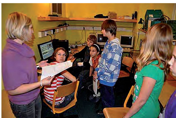
Mediální kroužek pracuje na plné obrátky ...