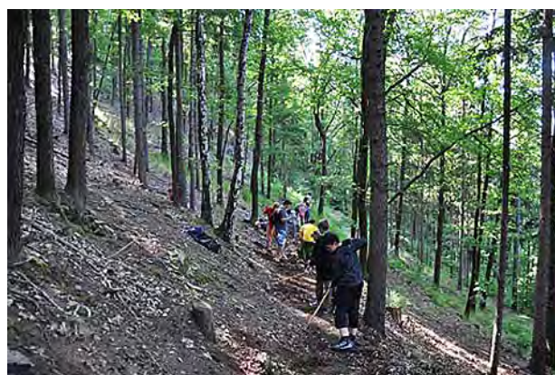
Žáci z II. stupně upravovali turistickou stezku.