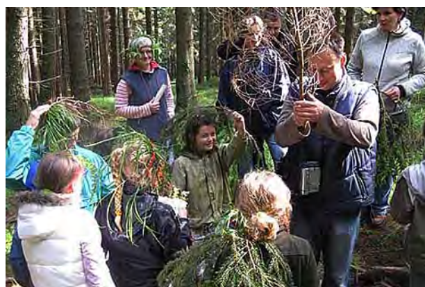
Na výletě i s rodiči ...