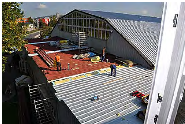
Generální oprava střechy na tělocvičně ...