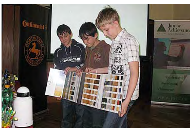
Úspěch na celostátní soutěži ve Zlíně ...