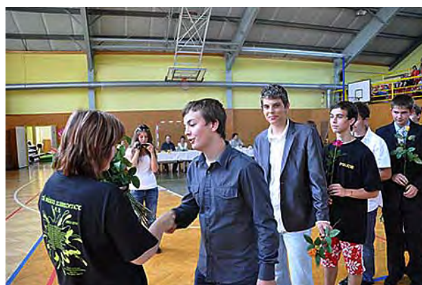
Rozloučení deváťáků ...