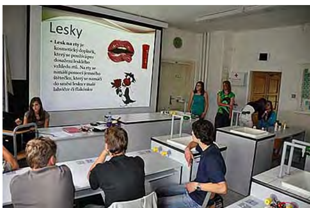
Projektová výuka v chemii ...