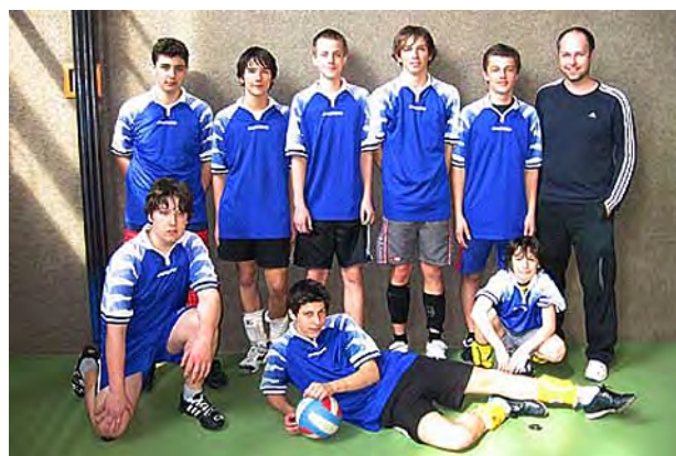
Naše volejbalová reprezentace ...