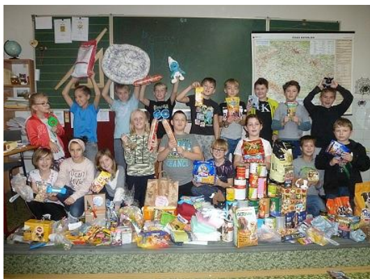
Sbírka pro pejsky...