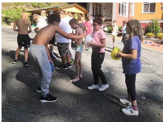
Adaptační kurz 6. tříd...