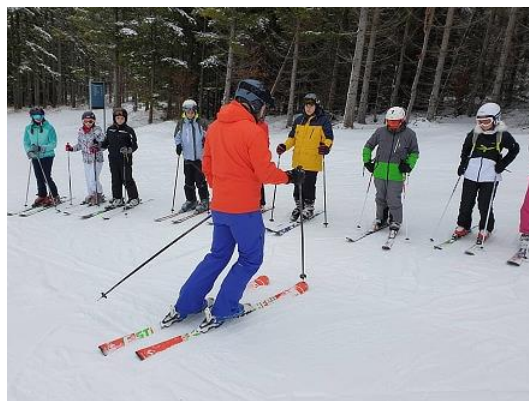
Lyžařský výcvik 7. tříd...