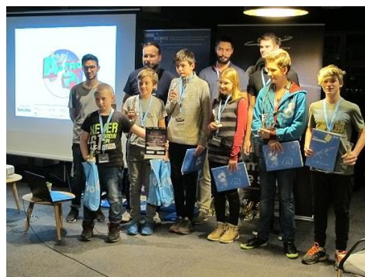
Astro Pi...(1. místo)