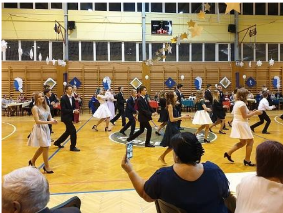
Taneční a pohybová výchova...