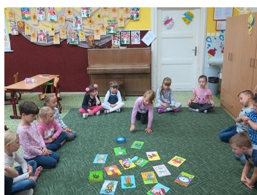
Čtení v 1. třídě...