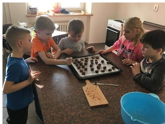
Peče celá škola...