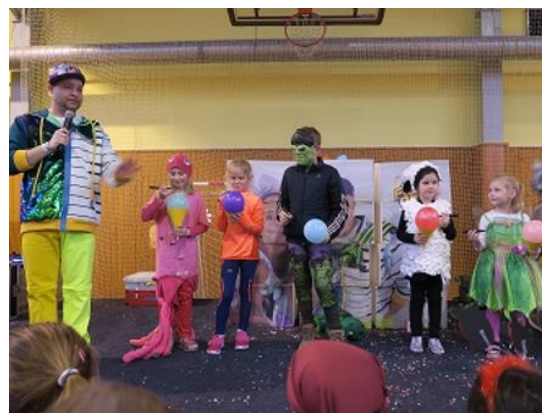
Karneval plný smíchu...