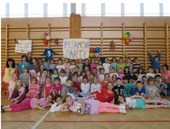
Pyžamová párty v ŠD...