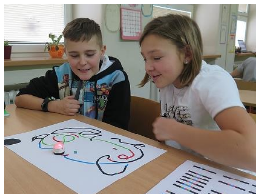
Práce s Ozoboty...