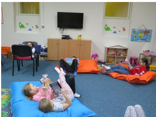
Čtenářský klub v ŠD...