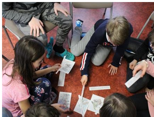
Beseda Božena Němcová...