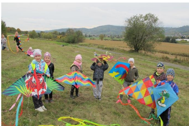
Drakiáda v ŠD...