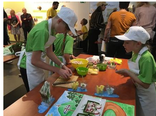
Kuchařská soutěž Zdravá5 Praha...