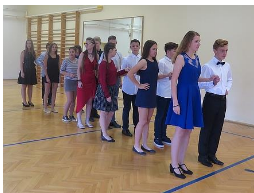
Taneční a pohybová výchova...