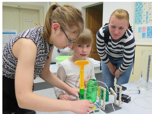
Den otevřených dveří...