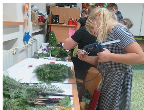
Výroba adventních věnců...