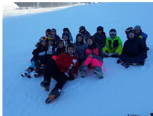
Lýžařský výcvik sedmých tříd...