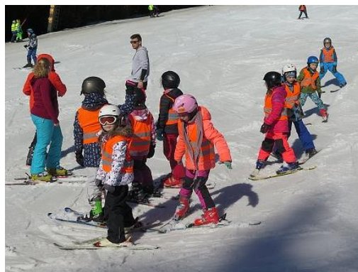
Lyžařský výcvik nižší stupeň...