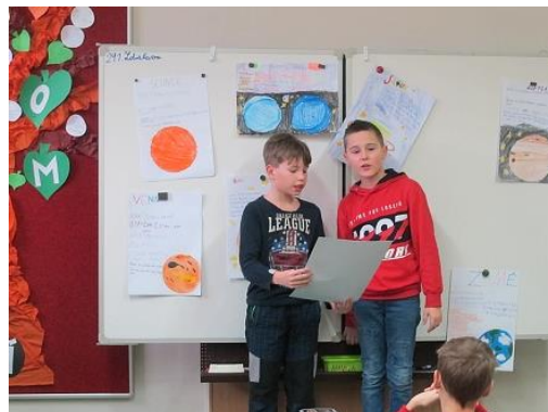
Projekt 3. třídy vesmír...