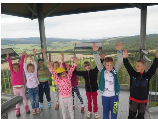
Výlet na rozhlednu...