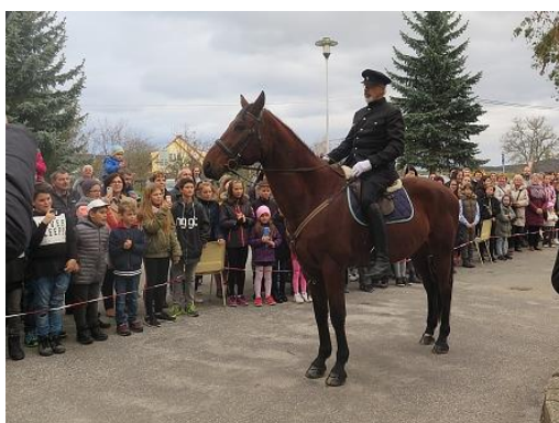
Oslava výročí republiky...