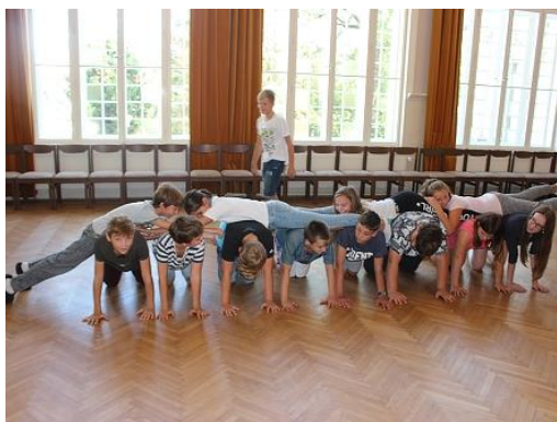
Adaptační kurz šestých tříd...