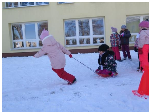
Družinová zimní olympiáda...