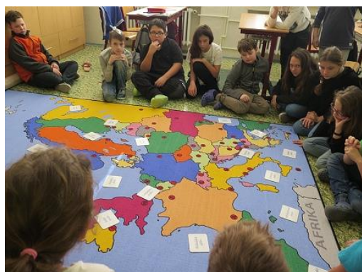
Projekt 5. třídy světadíly....