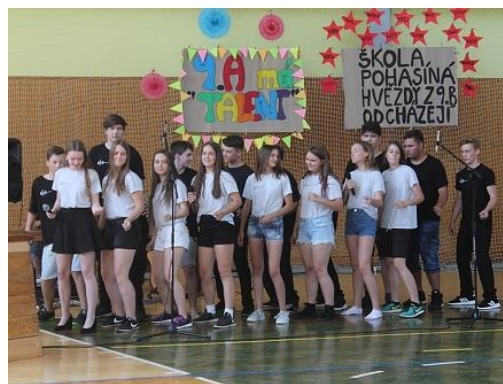
Rozlučka devátých tříd...