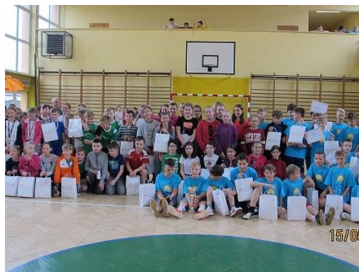
Spolupráce s polskými kamarády....