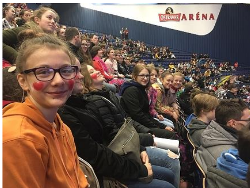
MS v para hokeji...