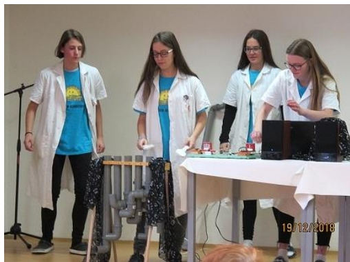
Fyzshow s hudbou...