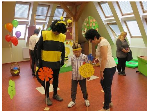
Zápis do prvních tříd...