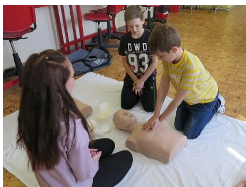
Základy první pomoci...