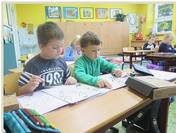
Psací písmenka nám nedělají problém...