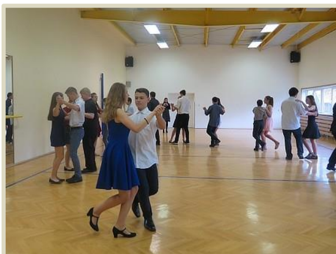
Válíme polku, blues....